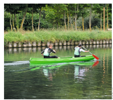
Cartographie et mise en page Interstice Lens - Reproduction interdite